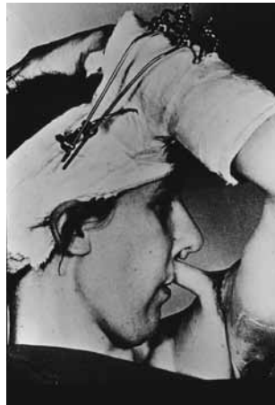
Figuur 3. Tagliacozzi's armlap in een modern jasje gestoken door Gillies ter sluiting van een lip en palatumdefect.

ris Bob Seymour, die in de Eerste Wereldoorlog was getroffen door een granaatscherf in zijn gelaat en diverse operaties moest ondergaan. Het theoretisch plastisch-chirurgisch onderwijs op basis van de 'Tien Geboden van Gillies' werd er ingestampt en men leerde het vak verder in de praktijk van alledag. Na de oorlog kwam Thomas (Tommy) Pomfret Kilner bij hem het plastisch-chirurgisch handwerk leren.